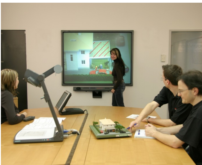
Kleine Details ganz groß

Aufgrund der einfachen Bedienung und der Flexibilität, die der Visualizer während der Präsentation bietet, wird er mittlerweile vielseitig eingesetzt und ist aus dem Arbeitsablauf nicht mehr wegzudenken. Der VZ-9plus wird nicht nur bei internen Schulungen und Besprechungen sondern auch bei Baustartgesprächen, Baubesprechungen mit Architekten, bei Produktvorstellungen und vielem mehr intensiv genutzt.